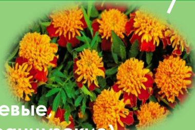
Бархатцы оранжевые, отклоненные (французские)