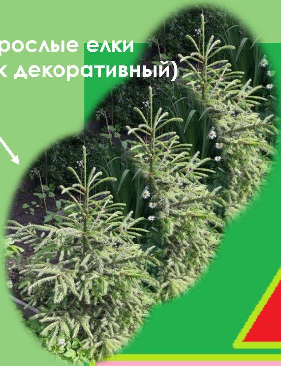
Среднерослые елки (хвойник декоративный)