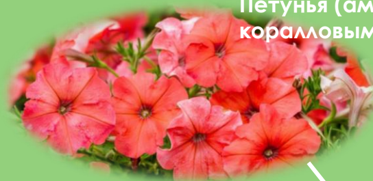
Петунья (ампельная) красным и коралловым цветом