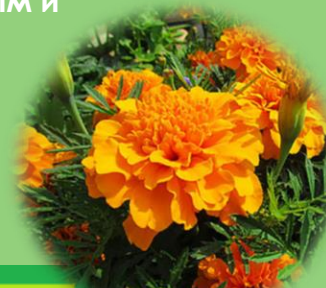
Бархатцы оранжевые, отклоненные (французские)