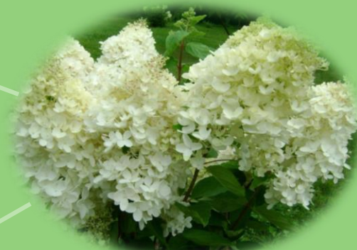
Гортензия белая MAGICAL PEARL